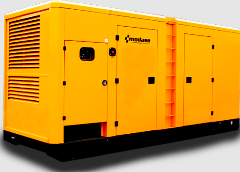
GRUPO ELECTRÓNICO INSONORO