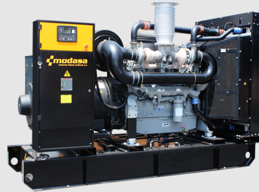
GRUPO ELECTRÓNICO ABIERTO

* Nota: Imágenes referenciales, pueden variar dependiendo de los accesorios