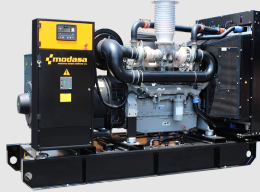
GRUPO ELECTRÓNICO ABIERTO

* Nota: Imágenes referenciales, pueden variar dependiendo de los accesorios