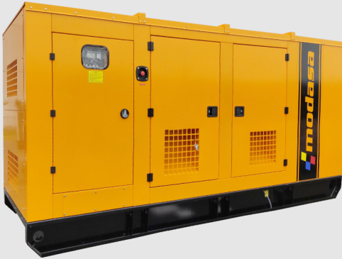
GRUPO ELECTRÓNICO INSONORO