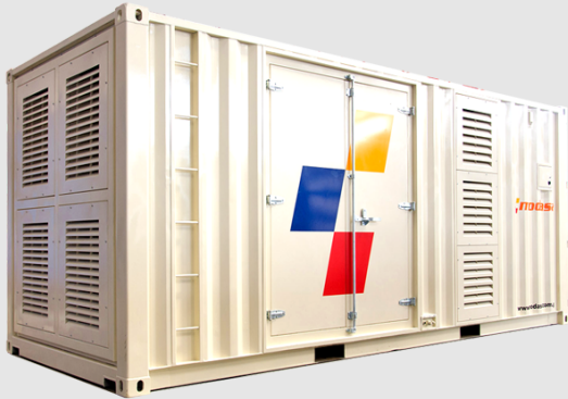
GRUPO ELECTRÓNICO INSONORO