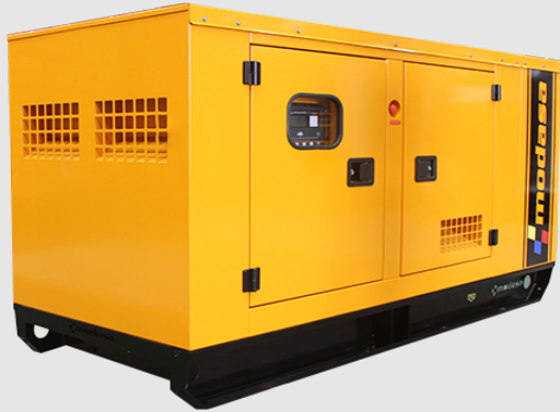
GRUPO ELECTRÓNICO INSONORO