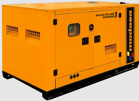
GRUPO ELECTRÓNICO INSONORO