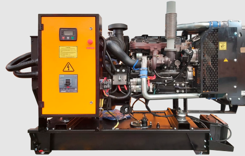
GRUPO ELECTRÓNICO ABIERTO