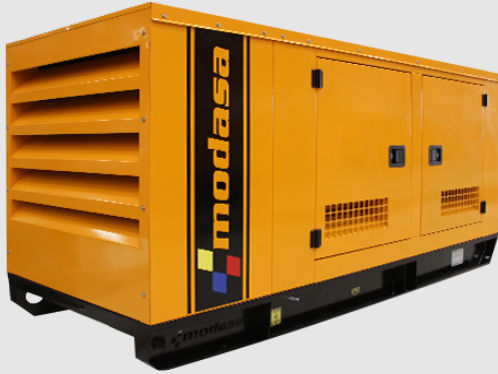
GRUPO ELECTRÓNICO INSONORO