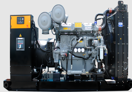
GRUPO ELECTRÓNICO ABIERTO